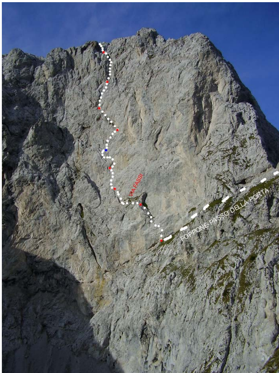
sentiero della Porta

Itinerario di stampo classico, il primo tiro è stato salito grazie all'utilizzo di uno spit, messo dal basso in apertura. Impegnativo vista la chiodatura parca e la roccia in più punti delicata.